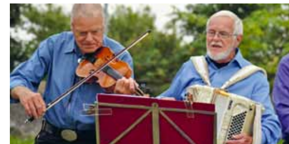
Internationella fyrdagen firas 3:e helgen i augusti.