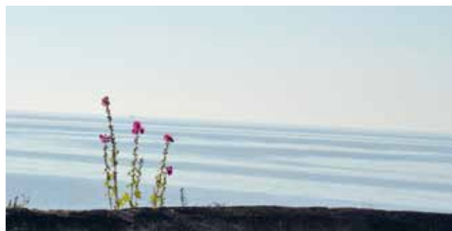
Här möts himmel och hav.

Söderslättis småvägar med dess byar, kyrkor och vida sädesfält är spännande att upptäcka från cykelsadeln. Hyr en cykel och utforska omgivningarna. Fiska, fågelskåda eller klättra upp i fyren och låt blicken vila mot horisonten! Varmt välkommen till ett hus med atmosfär – bli fyrvaktare för en natt!