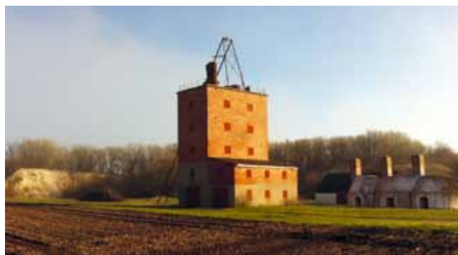
I Smyge med omnejd bröt man kalk fram till 1950-talet. Kalkugnar ute på slätten vittnar om den tiden. Hamnen var en gång ett kalkbrott och det gamla kalkberget ligger i dagen när det är lågvatten, miljoner år gammalt.