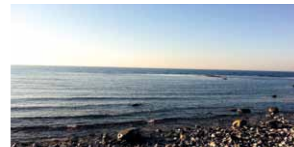
Här fiskar man laxöring på våren, bara att dra på fiskebyxorna och vada ut.

Fyrvaktarbostaden med nio rum har plats för totalt 28 personer. Fyrvaktarbiträdet Hittinus lilla vindskammare är idag ett vackert dubbelrum med utsikt över hav och fyr. Sommartid öppnar vi även två rum i bagarstugan. Hundar är välkomna i vissa rum. På vandrarhemmet finns ett välutrustat självhushållskök samt ett litet samlingsrum med tv. Huset är delvis handikappanpassat med ramp och anpassad dusch och toa. Konferens- och möteslokal i Mistlurshuset för ca 20-25 pers.