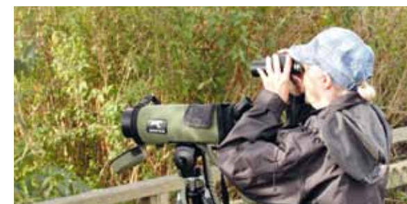
Smygehuk är ett bra utgångsläge för fågelskådaren.