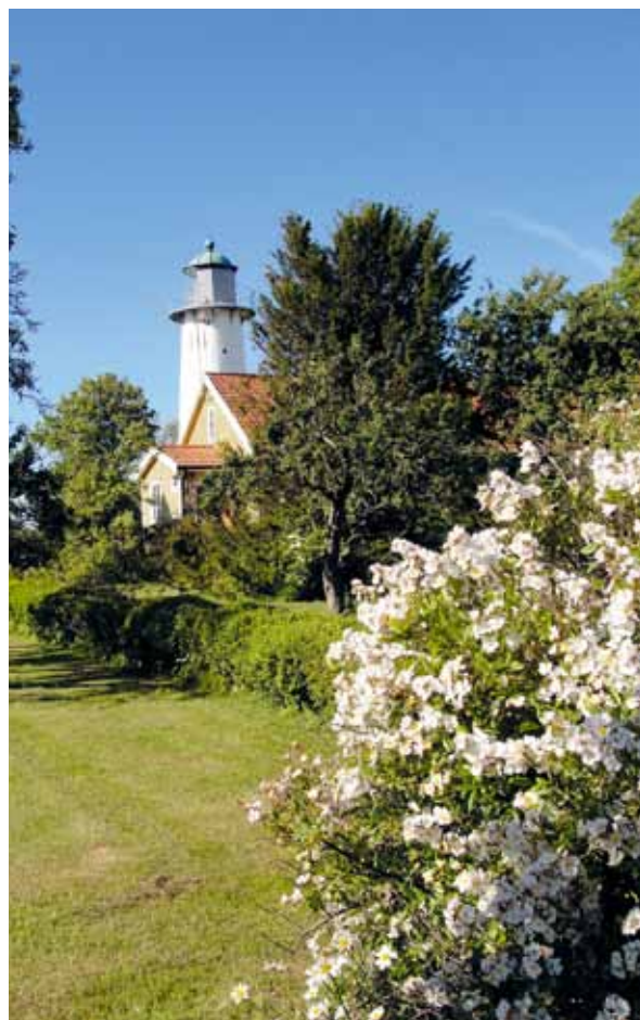
Trädgården inbjuder till lekar och spel – eller så sitter man på sjösidan och låter blicken vila långt ut över havet.